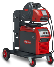
TransSteel 4000 Pulse