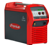
TransSteel 5000 Pulse